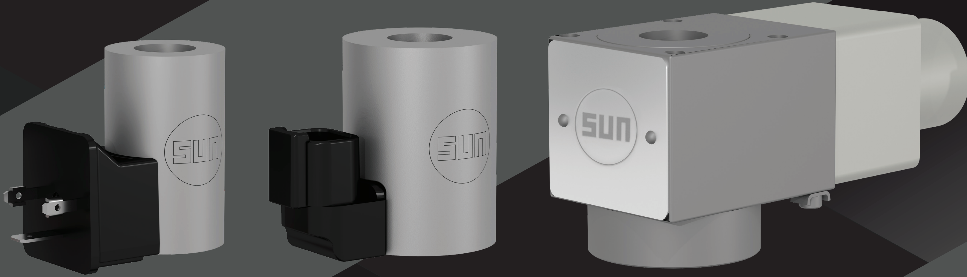
Bobina de baja potencia